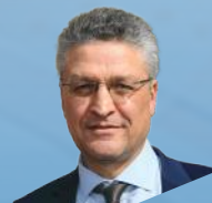
Prof. Dr. Lothar Wieler