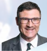
Dr. Stefan Kaufmann

Hydrogen Executive Advisor to the Board, Thyssenkrupp AG