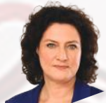
Dr. Carola Reimann

Vors. d. geschäftsf. Vorstandes, AOK-Bundesverband