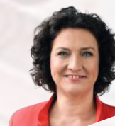
Dr. Carola Reimann

Vors. d. geschäftsf. Vorstandes, AOK-Bundesverband