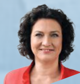
Dr. Carola Reimann

Vors. d. geschäftsf. Vorstandes, AOK-Bundesverband