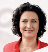
Dr. Carola Reimann

Vors. d. geschäftsf. Vorstandes, AOK-Bundesverband